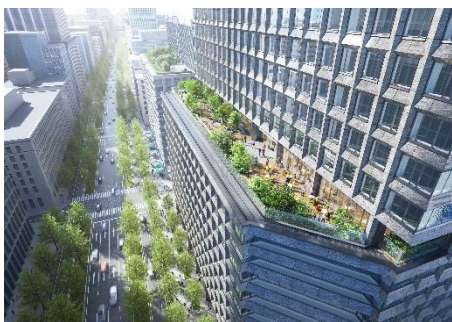
<ビル 11 階屋外庭園 CG パース>

内装の一部には、「EXPO2025 大阪・関西万博」の「住友館」で使用されていたスギ材をアップサイクルしたウッドウォールを配置しています。多くの来場者を迎えた歴史的な木材を廃棄せず再利用することで、働く人に癒やしをもたらす快適なワークスペースと、SDGs への貢献を両立させました。