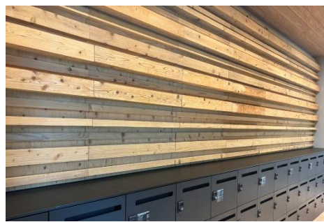
<住友館のスギ材を再利用したウッドウォール>