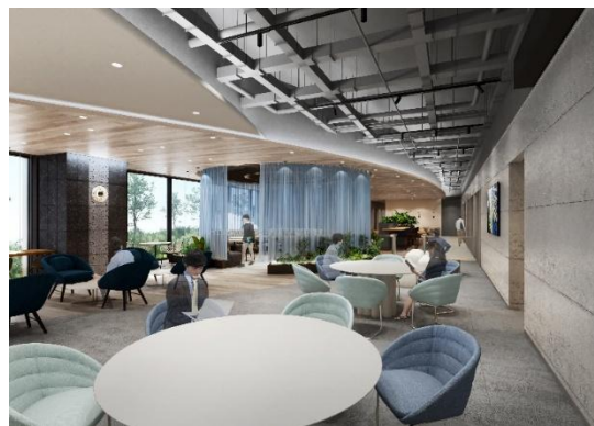
<ラウンジ完成予想 CG>

弊社が出店する「淀屋橋ゲートタワー」は、淀屋橋駅西地区市街地再開発組合が推進する、駅直結の大型複合ビルです。弊社はこのビルの11階にて、“公共貢献”をコンセプトとした新たなサービス付レンタルオフィスを展開いたします。